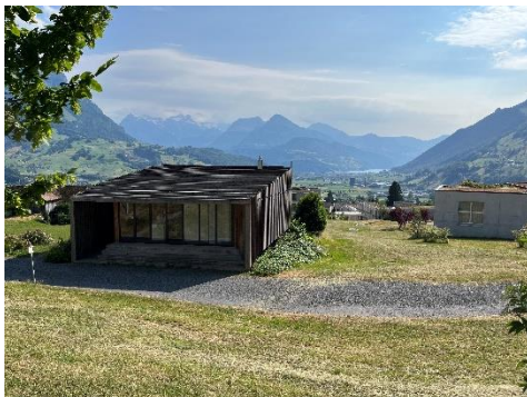
Aussicht in den Talkessel Schwyz