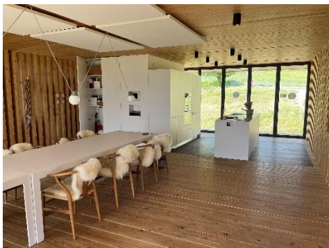
Küche, Aufenthaltsraum und WC