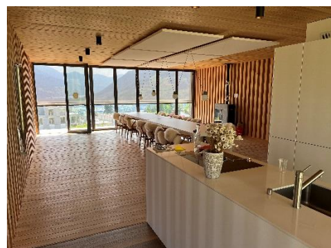
16 bis 50 Personen möglich