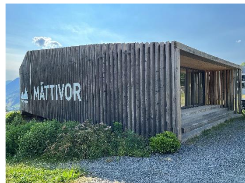
5 Minuten Fussmarsch vom Kollegi